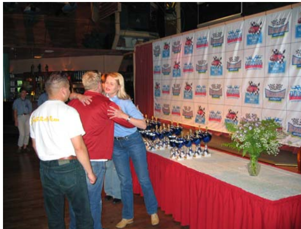
Waltikka-Ralli aiettu ja parhaat saaneet palkintonsa.