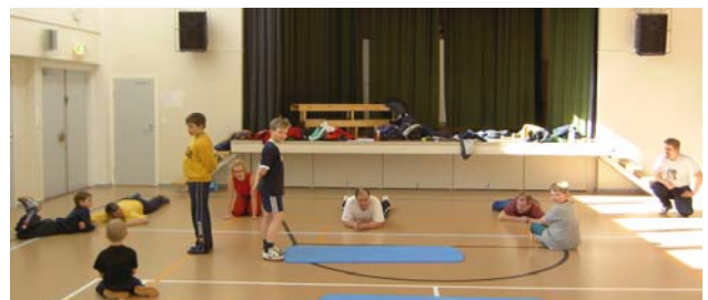
Kuvassa nuoremmat seuraavat kun "vanhemmat vahvistavat vatsalihaksiaan vatsallaan maaten".

Peruskuntokausi on sitten ohi ja kuntotestit on suoritettu. Niihin osallistui 14 urhoollista atleetikkoo nuoresta "vanhaan". Eräistä piireistä alkoi puusutus kuulua jo alkulämmittelyn aikana ja kyseltiinkin, josko testi olisi ollut tässä. Mutta armoa ei annettu. Oli punnerrusta, vatsalihaskonetta, kyykkyjä, pituushyppyä ym. Tekeminen ei heti loppunut. Hikeä riitti ja tosissaan vedettiin. Kaikki kilpailivat, mutta vain itsensä kanssa. On mielenkiintoista nähdä miten kesä vaikuttaa tuloksiin, sillä testi uusitaan syksyllä. Silloin sen sitten näkee, tuliko istuttua kämpperi kourassa grillitassuja nuotiolla käänellen. Mutta no hätä. Eivätköhän ne ylimääräiset kilot pois karise syksyllä, kun päästään taas pelailemaan jopa kahdessa vuorossa. Epäilen, että tämä edellä mainitussa lauseessa sana kilot koskee ensisijaisesti varttuneempaa väkeä, eikä niinkään meidän kartkuskeja.