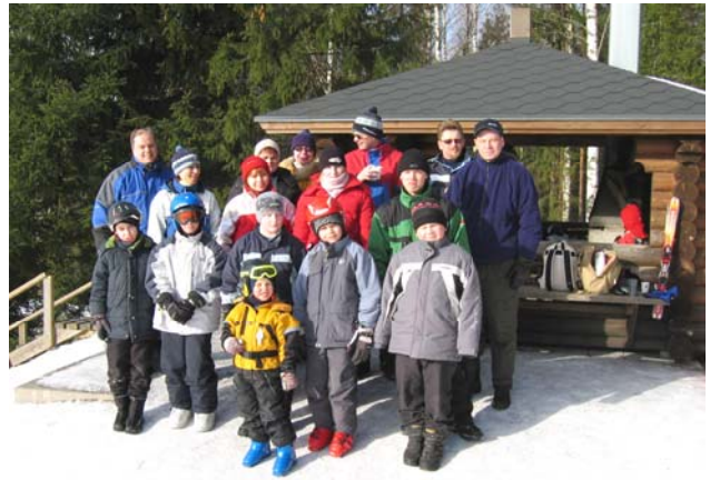
Liikuntapäivänä kuvaushetkellä paikalla olleiden ilmeet olivat iloisia kirpeästä talvisäästä huolimatta.