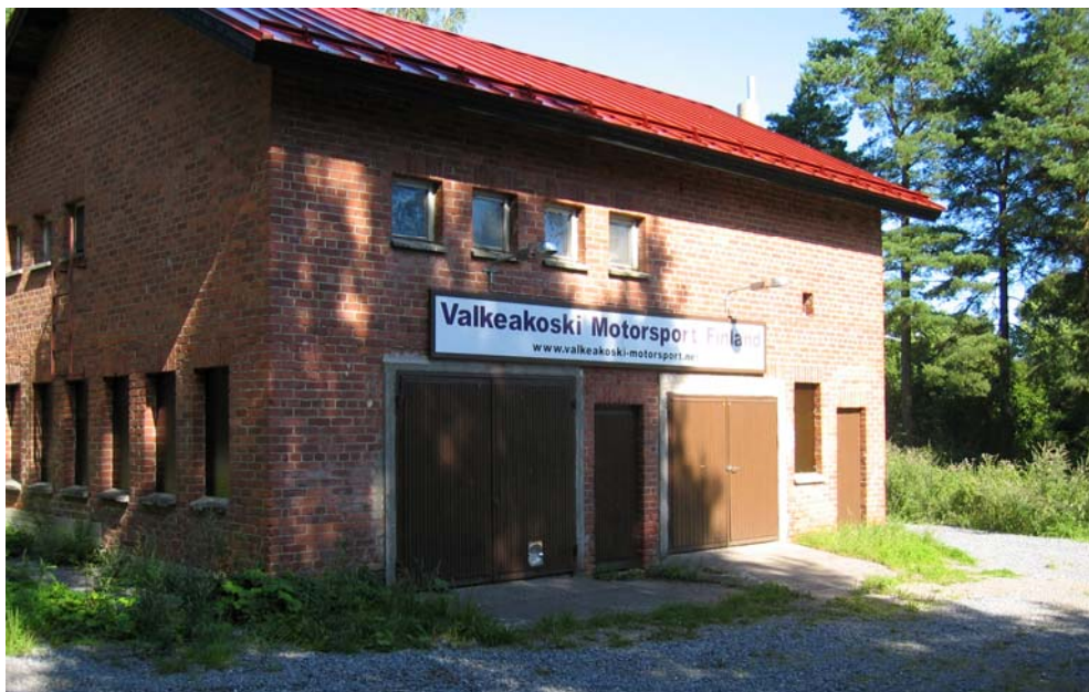
Vanha Säteri Oy:n rivitaloalueen sauna- ja pesularakennus on nyt "varikko"

"Ainut, missä menestys tulee ennen työntekoa, on sanakirja!"